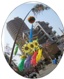
青空にたなびくひまわり 苦勞の甲斐がありました。