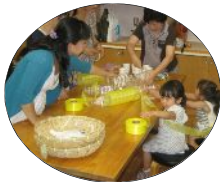
みんなで力を合せ、ペットボトルのひまわりを作成中!!