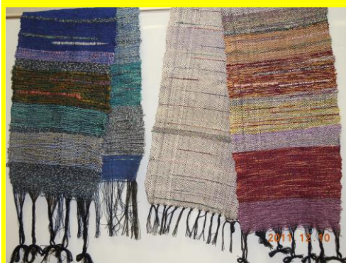
以前の参加者作品です